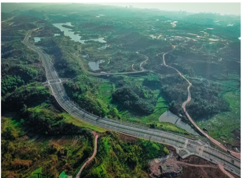
《六横线的春天》

“坚持才能胜利，我们将善始善终，争取大桥完美收官！”项目建设者们正在以坚定的决心意志和恒心毅力，向着2024年深中通道通车发起冲刺。